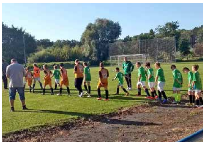
Starší přípravka – zápas ve Velkých Němčicích