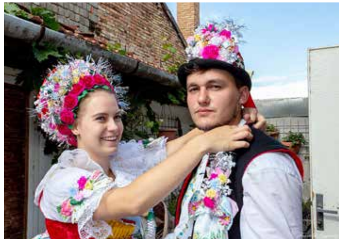
Tradiční hody