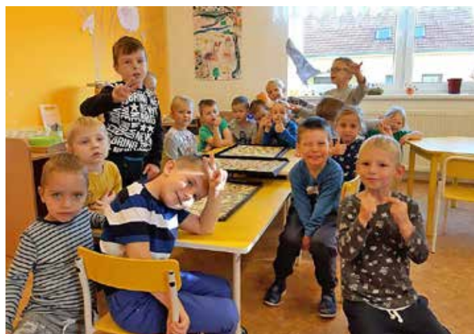
Děti pekly čajové pečivo