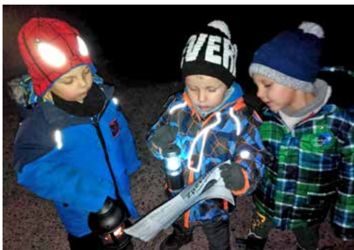
Zpívání koled na sóle