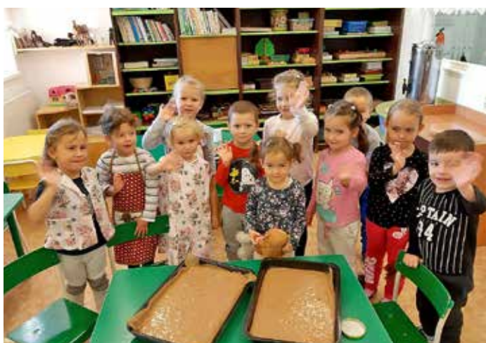
Šikovné ručičky dětí z MŠ