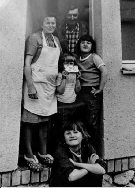
A tak si ji pamatujeme z dětství.