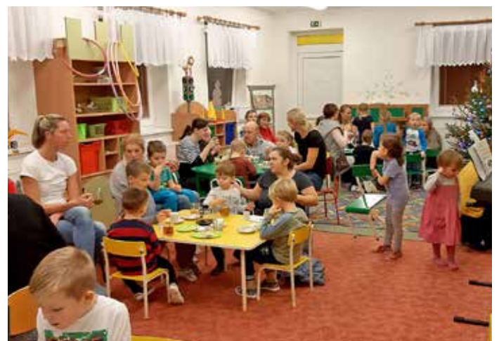
Vánoční těšení v MŠ