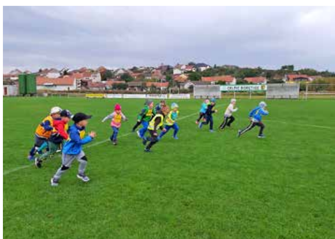
Běh za bořetickým hrozdem