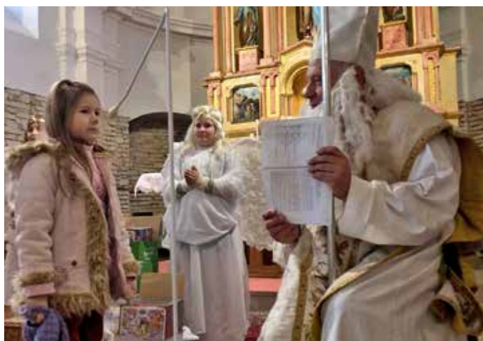
Sv. Mikuláš v kostele