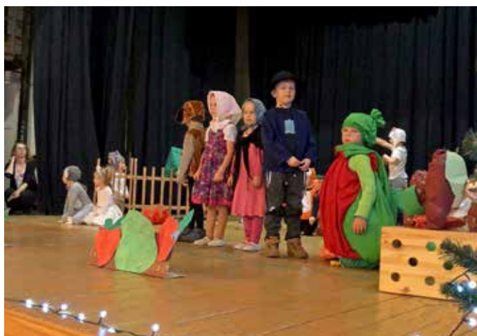
Setkání se seniory