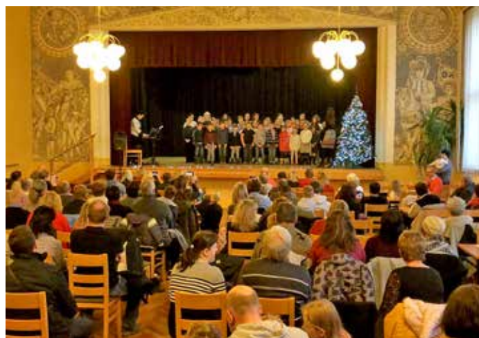
Setkání se seniory