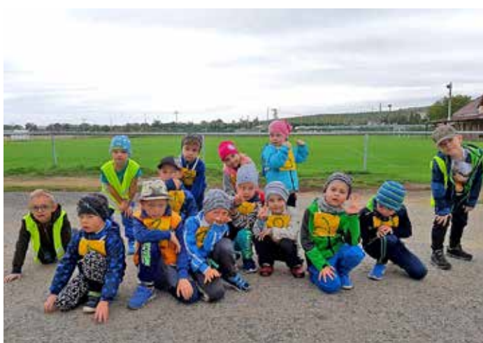
Děti z MŠ a jejich příprava na běh za bořetickým hrozdem