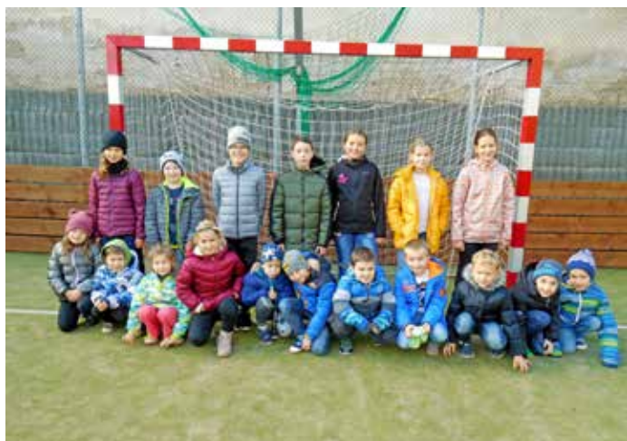
Sportování ve školní družině