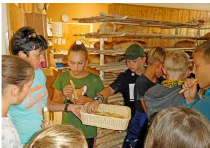
Projektový den v Pekařství u Valů