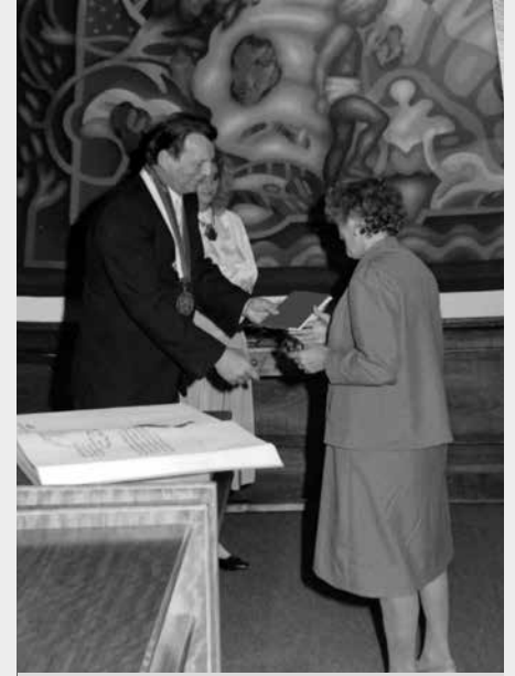
Tady dostává ocenění při setkání totálně nasazených.

Vzpomínky na babičku z dob mojí puberty nejsou tak růžové. Se sestrami jsme vždy zuřily, když o prázdninách brzy ráno pod našim otevřeným oknem začal vrčet řepák. Opalovat se na dvoře byla totální ztráta času, a neproduktivní válení na koupališti? No to jsme musely řádně odpracovat! Tehdy se mi zdála bezcitná, sobecká a nedohlédla jsem, proč je taková, co za tím je. Jaké zkušenosti, dřina a sebezapření ji zocelilo. Nyní jsem ráda, že jsem měla to štěstí, že mi babička odešla až v mém zralém věku a já ji mohla pochopit a ocenit, co nejen mně, ale celé rodině dala.