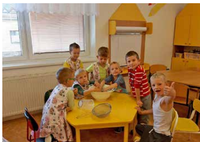
Vinobraní v MŠ