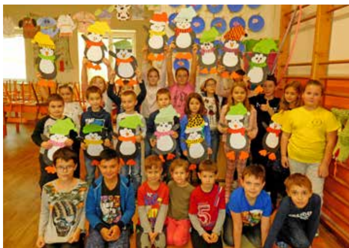
Zimní tvoření ve školní družině