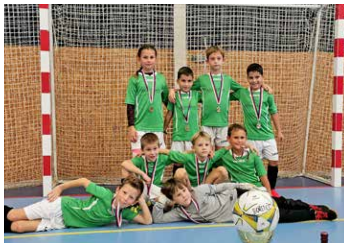
Turnaj v Moravském Krumlově