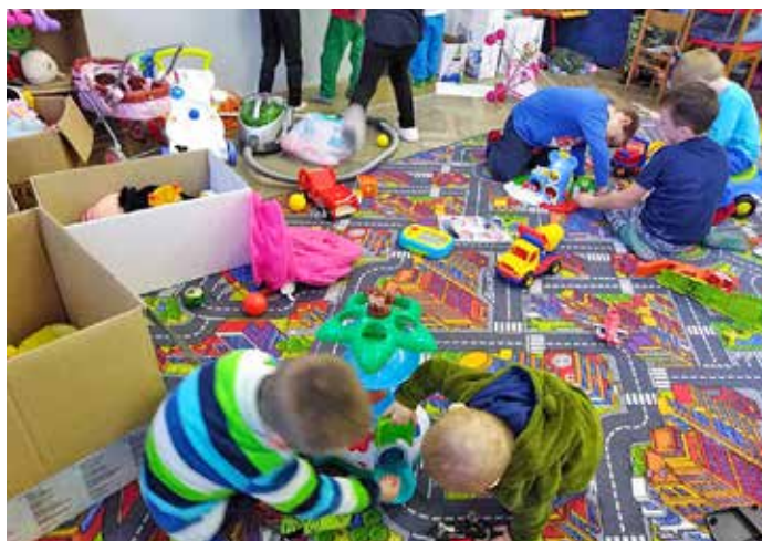
Klub maminek s dětmi Klubko