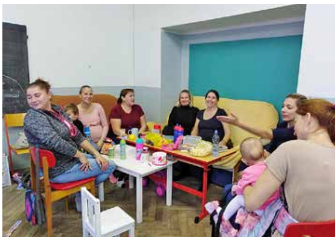
Klub maminek s dětmi Klubko