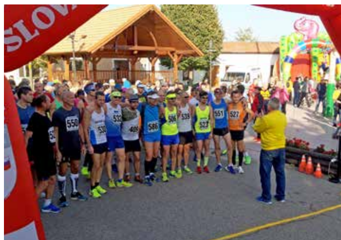
Z běhu za bořetickým burčákem