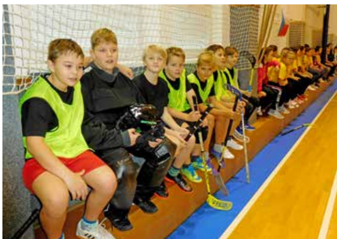
Florbalový turnaj v ZŠ Kobyli