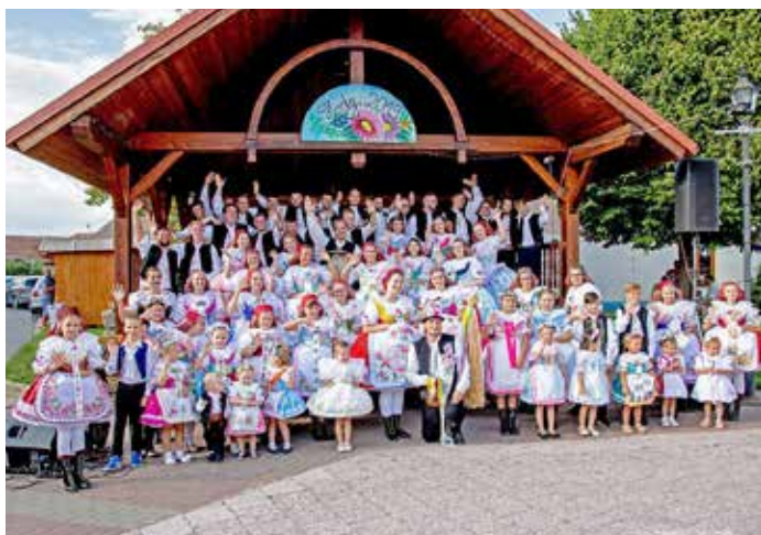
Tradiční hody