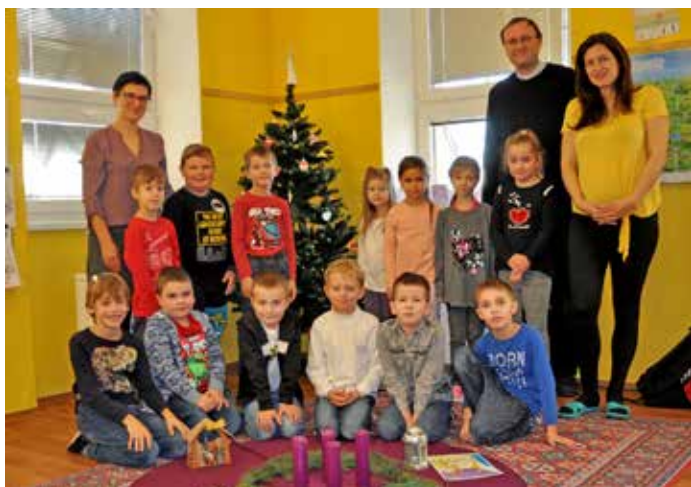
Výukový program "advent" ve škole