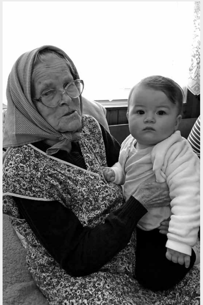
Se svojí nejstarší praprapravnučkou. Bábi děti milovala a ony měly rády ji. Obzvláště, když s ní mohly chodit popravovat kačeny a slepice. Čvachtat v kačeních „hovínkách“ je prostě životní zážitek!