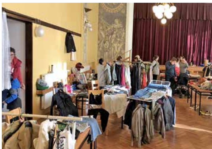
IV. bořetický bazárek