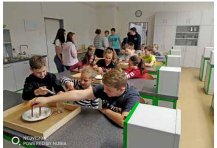
Akce „Věda je hra“ v ZŠ Velké Pavlovice