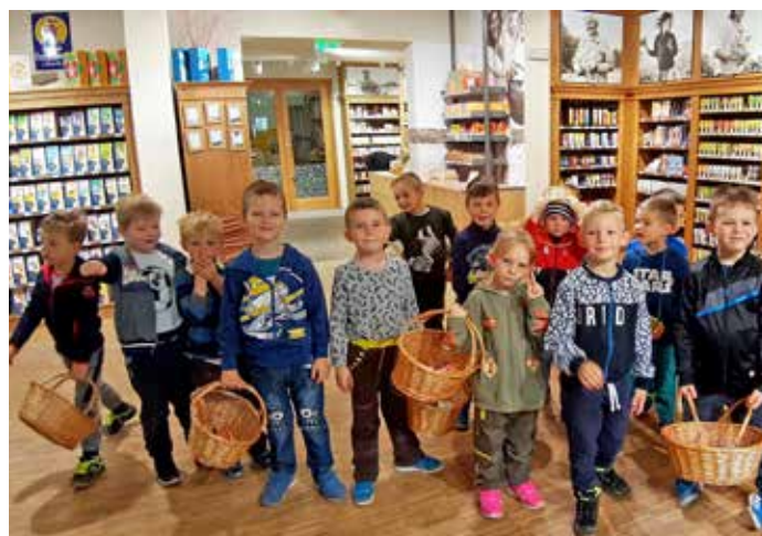
Děti si nakoupily drobné dárečky domů