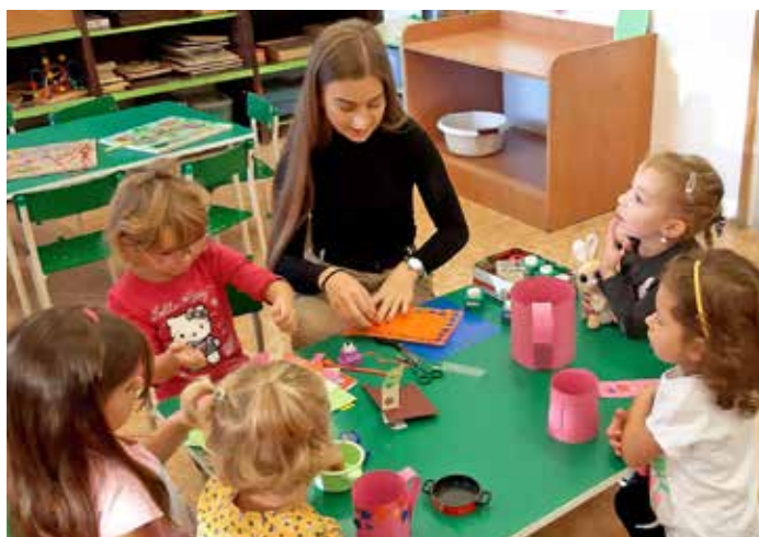
Výtvarné práce dětí z MŠ