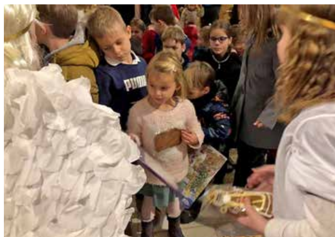
Sv. Mikuláš v kostele