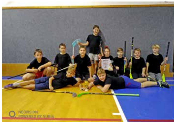
Florbalový turnaj v ZŠ Kobyli