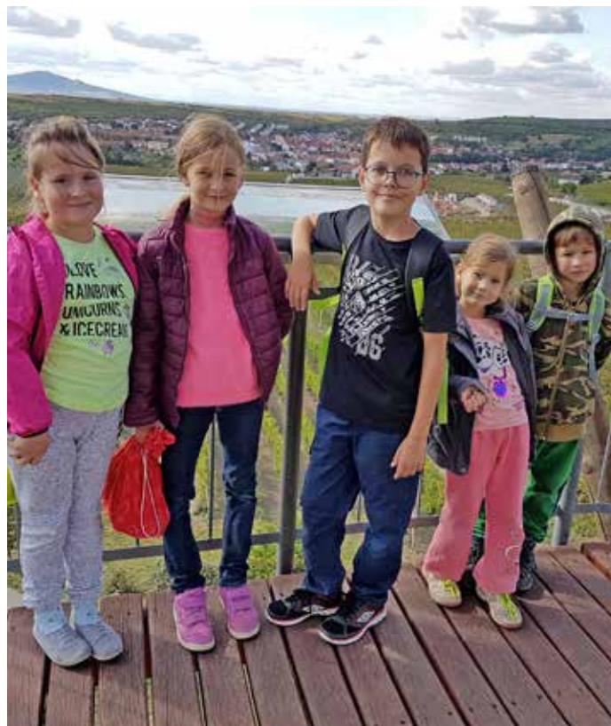
Turistický kroužek ve školní družině