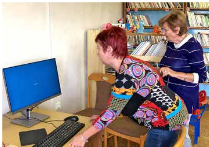
Nové vybavení knihovny