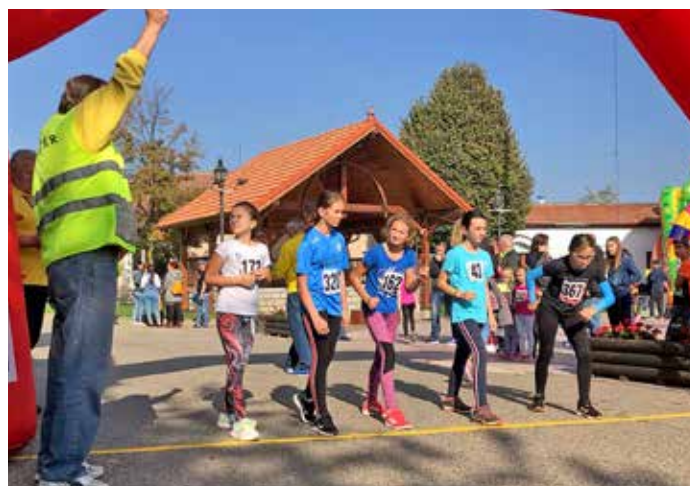
Z běhu za bořetickým burčákem