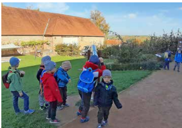
Exkurze dětí z MŠ ve firmě Sonnentor