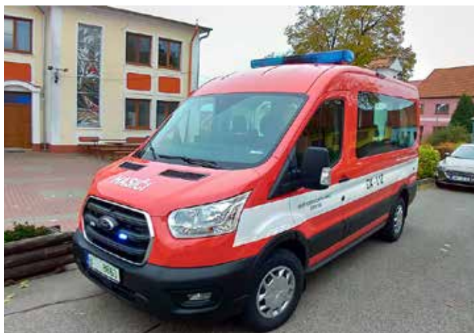
Nové dodávkové vozidlo Jednotky SDH