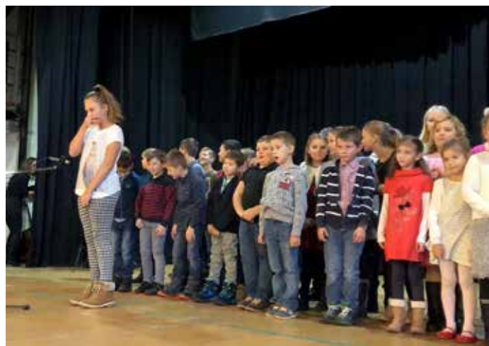
Setkání se seniory