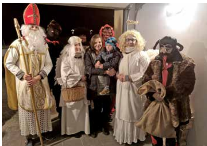
Hasičská mikulášská družina