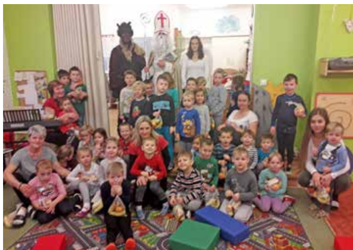
Sv. Mikuláš ve školce