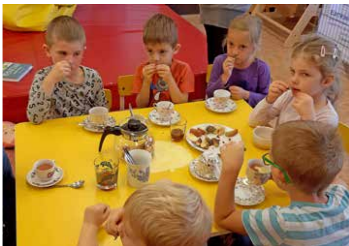
Děti poznávaly a popisovaly různé druhy bylin