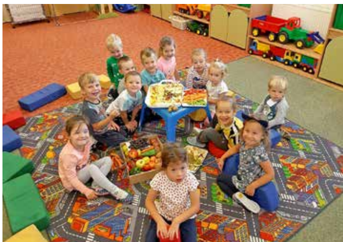
Podzimní hody v MŠ