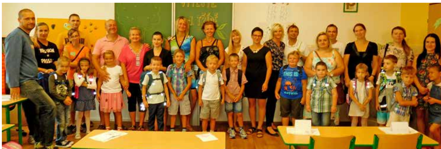
Zahájení školního roku 2019–2020