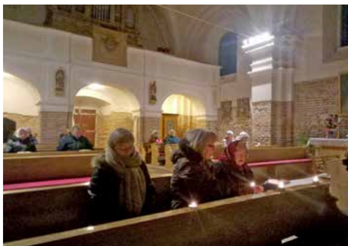
Roráty v kostele