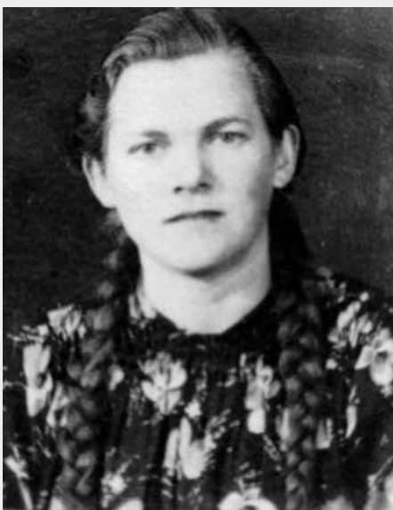
Babička dvacetiletá. Kočka, že?

Na moji otázku, jestli je na sebe pyšná, co všechno dokázala, mi odpověděla: „Tož su, nebo nejsu, musela sem to dokázat.“ A to byla její filozofie, je to tak a je třeba se s tím poprat.