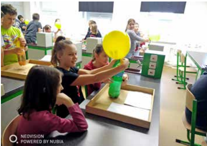
Akce „Věda je hra“ v ZŠ Velké Pavlovice