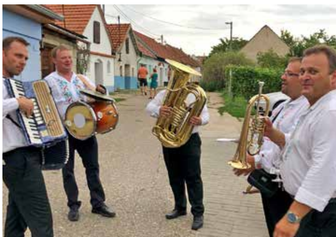
Noční otevřené sklepy