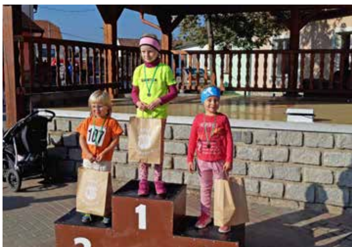
Z běhu za bořetickým burčákem