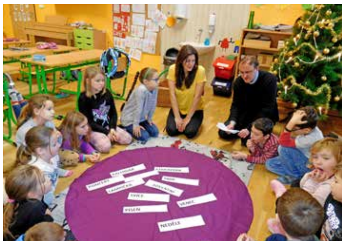
Výukový program "advent" ve škole