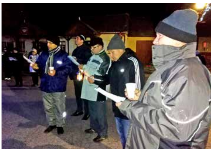
Zpívání koled na sóle