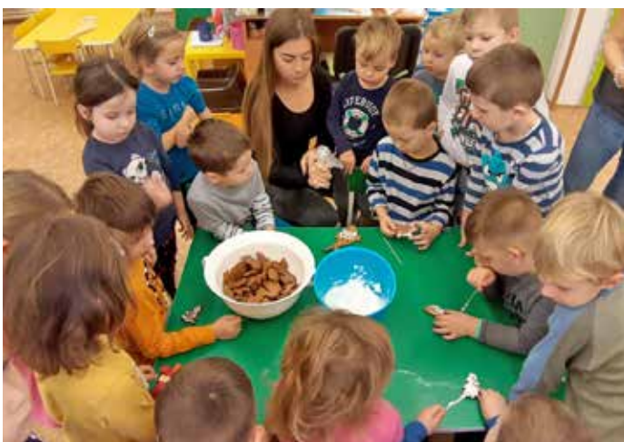
Vánoční těšení v MŠ