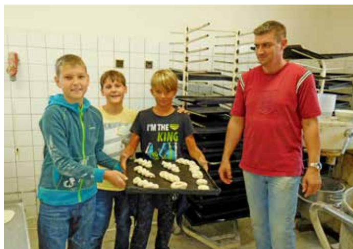
Projektový den v Pekařství u Valů