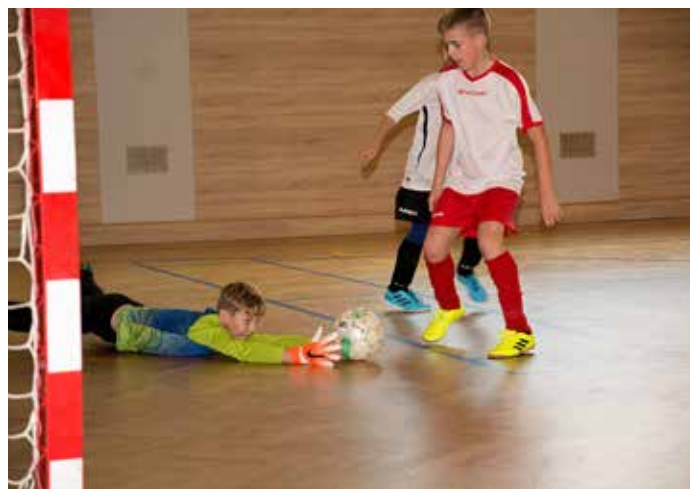
Mezinárodní fotbalový turnaj ve VP