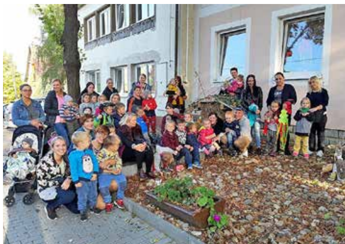
Výstavka výrobků z podzimního tvoření