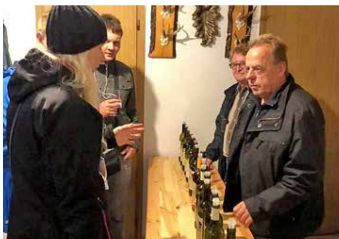
Putování za mladým vínem