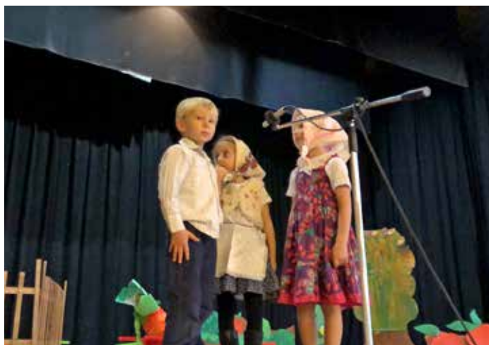
Setkání se seniory