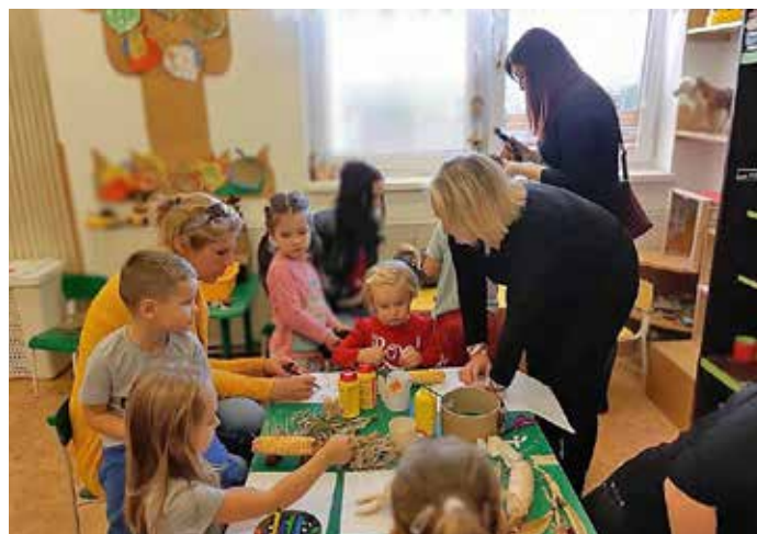
Podzimní tvoření v MŠ