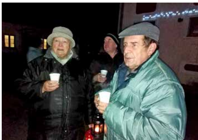
Zpívání koled na sóle