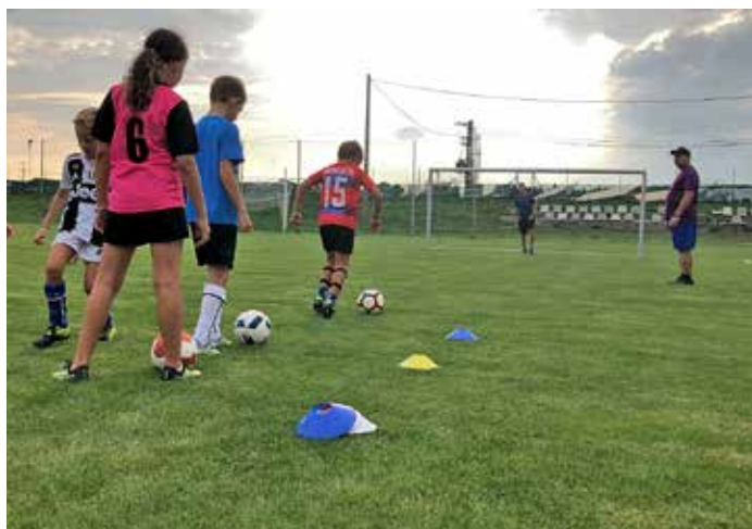
Tréninky našich fotbalových nadějí