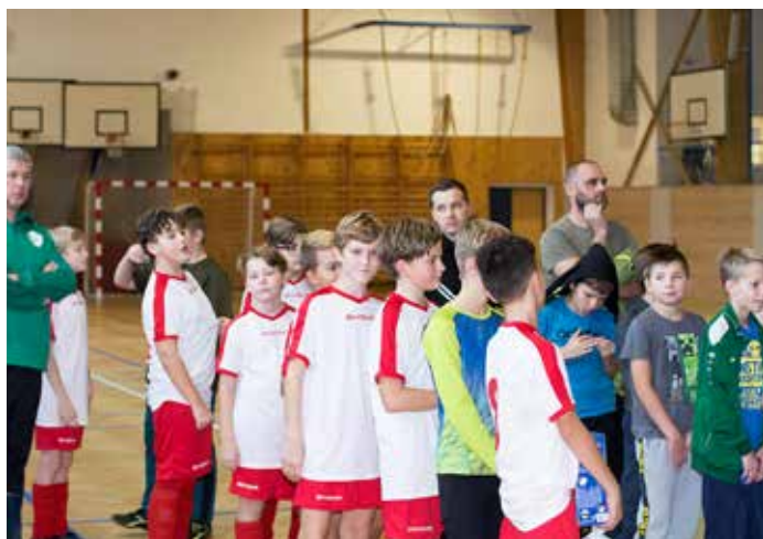
Mezinárodní fotbalový turnaj ve VP