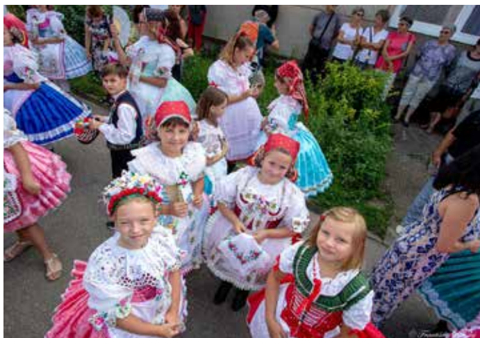
Tradiční hody