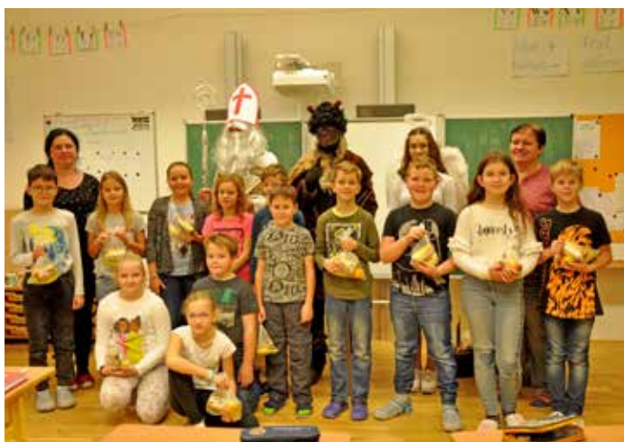
Mikuláš ve 4. třídě