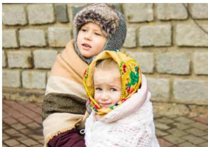
Předvánoční jarmark