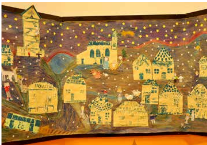
Betlém v Bořeticích – práce žáků 4. třídy