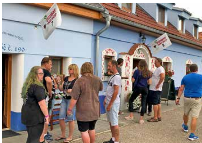
Noční otevřené sklepy