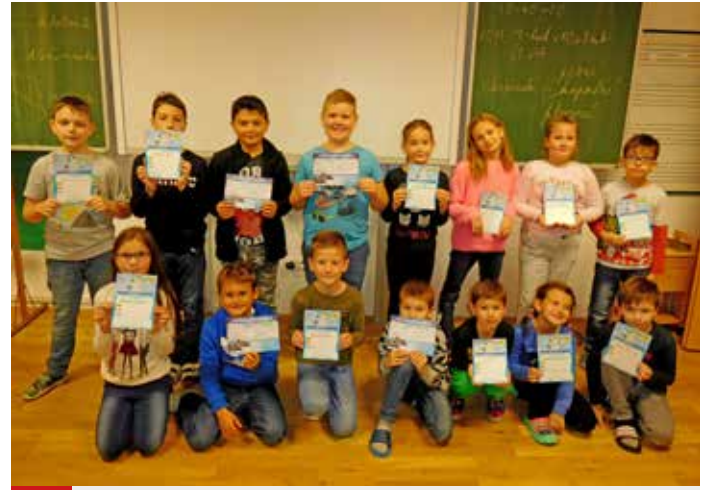
Mokrě vysvědčení – 2. a 3. třída