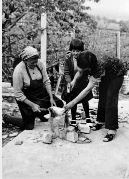
A tak si ji pamatujeme z dětství.