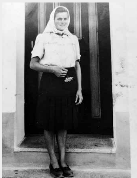
V kroji babička nechodila, oblékala se po panskou. Hlavně prakticky!