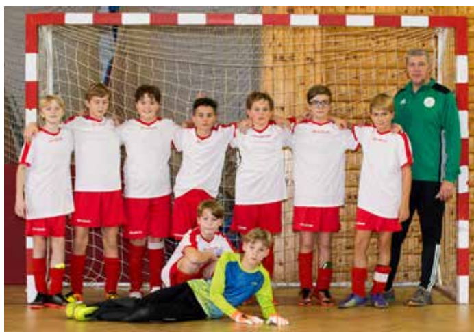
Mezinárodní fotbalový turnaj ve VP