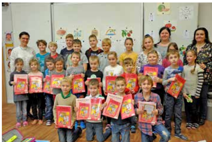
Slavnost předávání slabikáře v 1. třídě

Podrobnější informace o dění ve škole i školce včetně pestré fotogalerie můžete sledovat na naší adrese www.skolaboretice.cz .