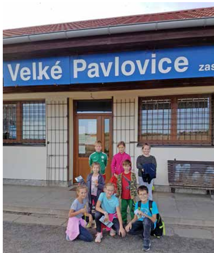
Turistický kroužek ve školní družině