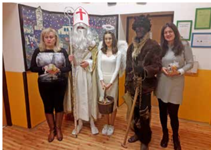
Sv. Mikuláš ve škole