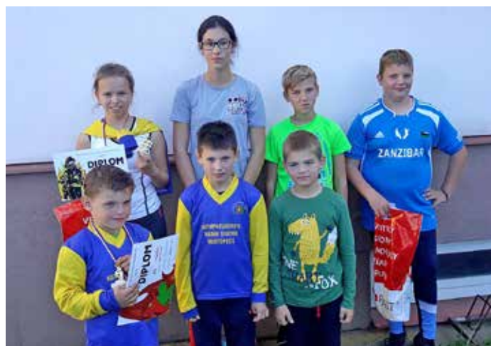
Závody mladých hasičů v Moravské Nové Vsi