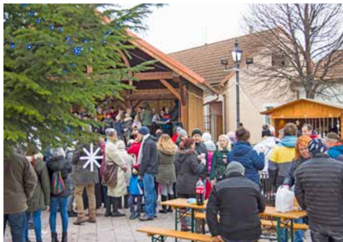
Předvánoční jarmark