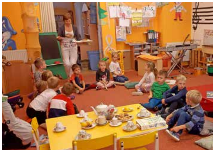
Děti připravily v MŠ rodičům čajovnu