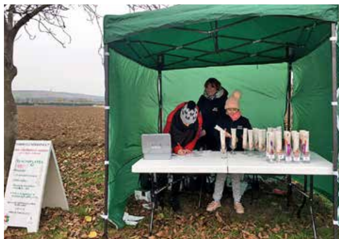
Putování za mladým vínem