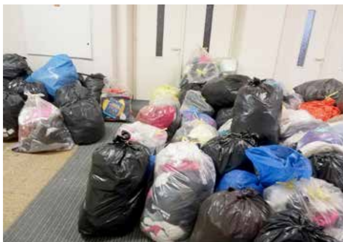
Sbírka pro Diakonii Broumov