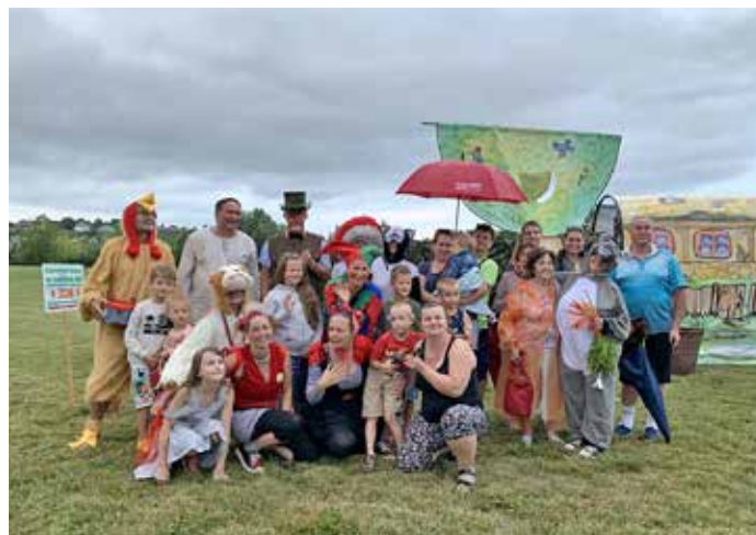
Divadlo Zvířátka a Petrovští, foto Morávkovi