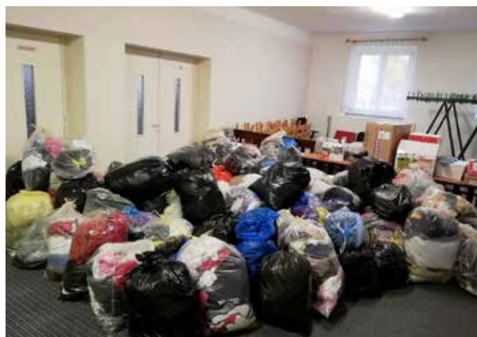
Sbírka pro Diakonii Broumov