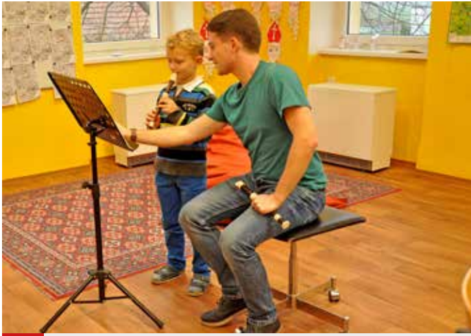
Hudební kroužek v ZŠ