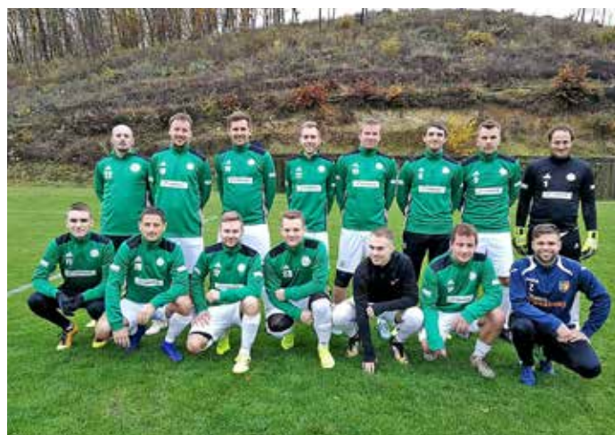
Muži na zápasu s Boleradicemi