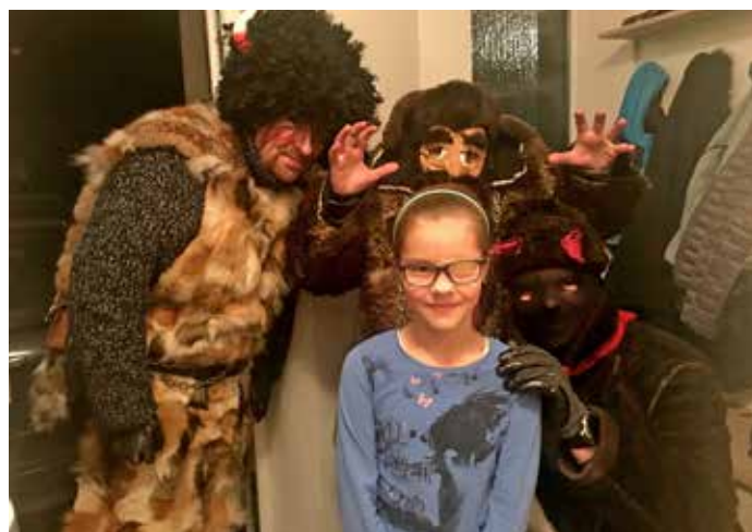
Hasičská mikulášská družina, foto rodiče