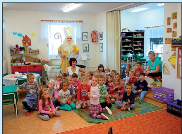
Mikuláš v MŠ