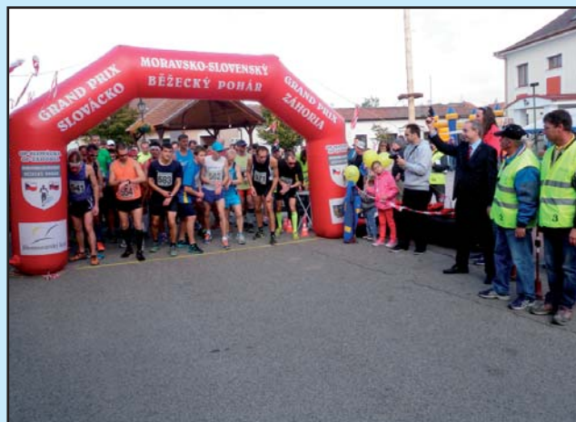
Start hlavního závodu Běhu za bořetickým burčákem – celkem 124. startujících