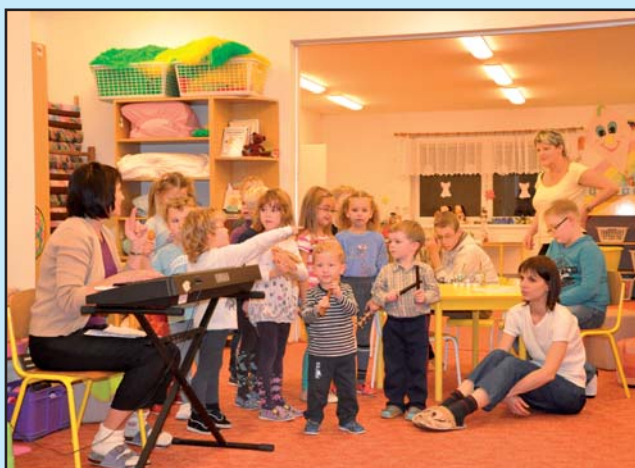
Vánoční těšení v MŠ