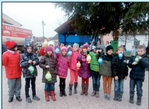
Zdobení vánočního stromu -2. třída