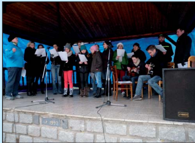
Tradiční Vánoční jarmark-vystoupení chrámové scholy Deo Gratias