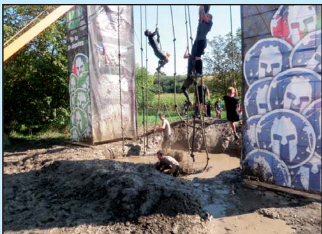
Běžecký závod Spartan race