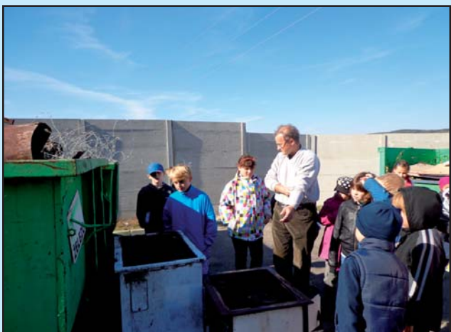
Přírodovědno- turistický kroužek na sběrném dvoře