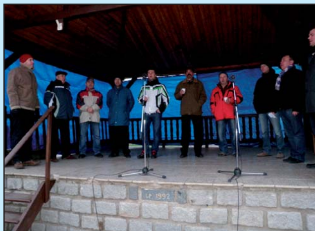
Tradiční Jarmark – vystoupení mužáckého sboru Svodničan