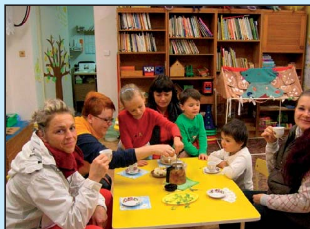
Ranní čajovna v MŠ 1