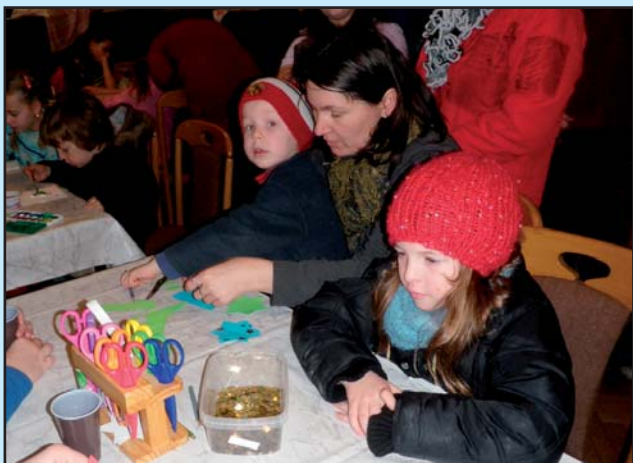
Tradiční Vánoční jarmark-dílnička