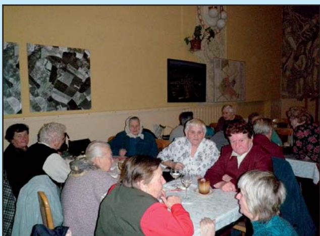
Beseda se seniory