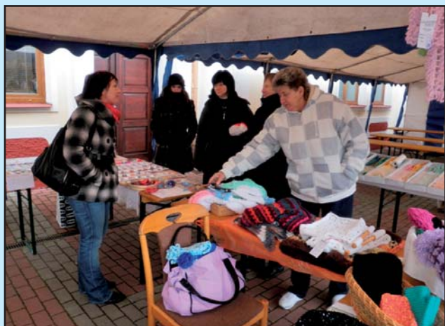
Tradiční Vánoční jarmark