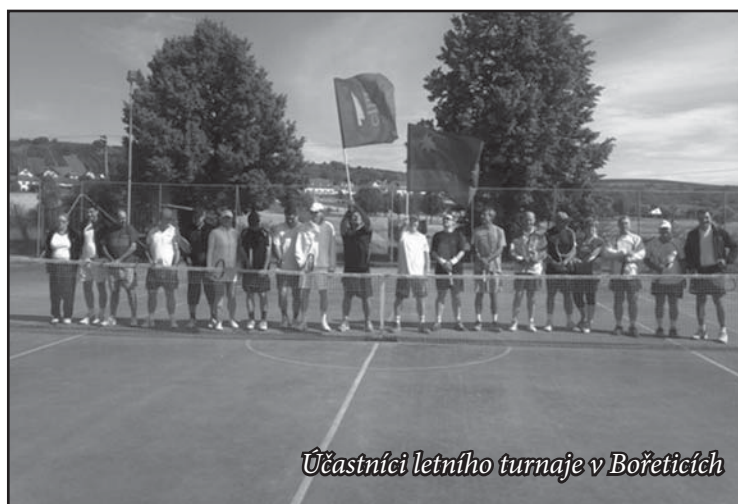
Účastníci letního turnaje v Bořeticích