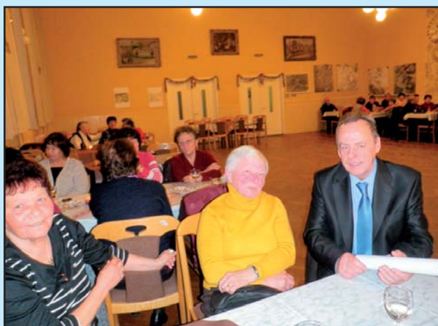
Beseda se seniory