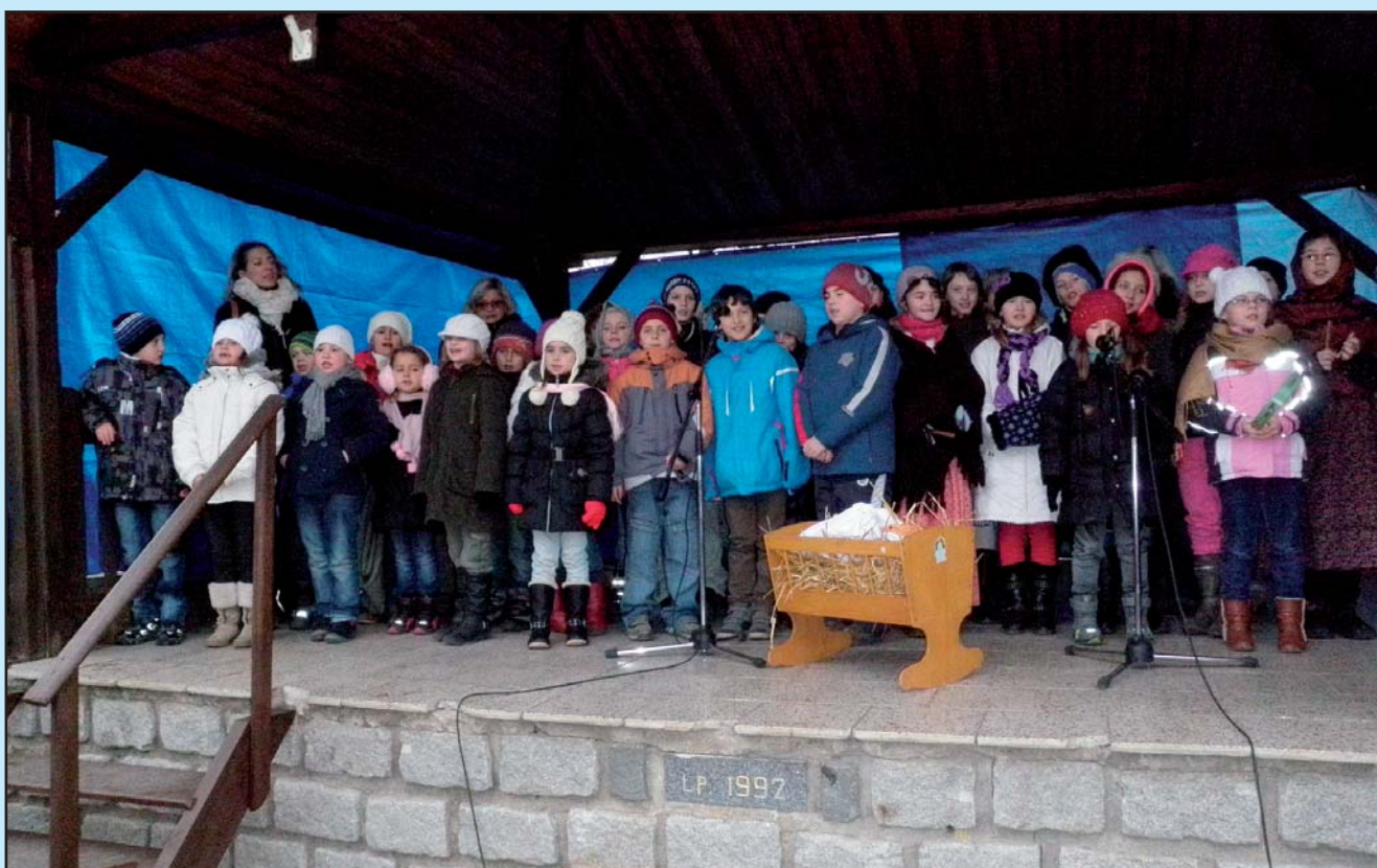
Vystoupení žáků ZŠ