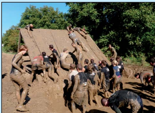
Běžecký závod Spartan race