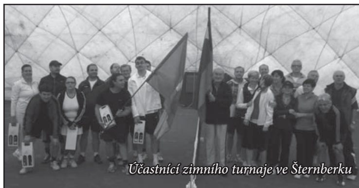
Účastníci zimního turnaje ve Šternberku

Jelikož se o tenis stále větší zájem, byl zpracován projekt na rozšíření víceúčelového hřiště. V této rozšířené části by byla postavena tréninková tenisová zeď a hřiště na streetball. Žádost o dotaci na MŠMT ČR byla podána již koncem září.