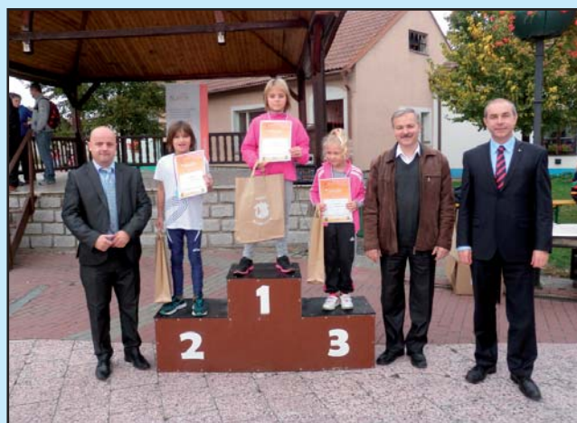
Vítězové Běhu Bořeticemi, dívky 8-9 let