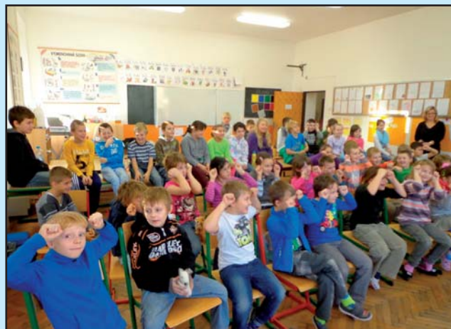
Hudební vystoupení v ZŠ