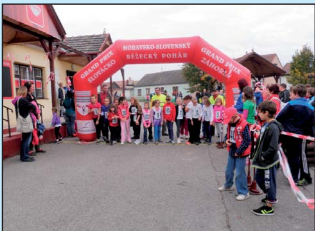
Start běhu v kategorii mladších žáků