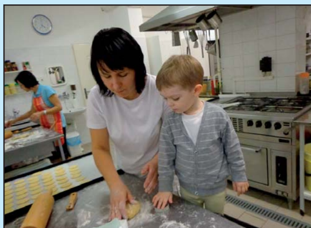
Výroba vánočního pečiva na jarmark