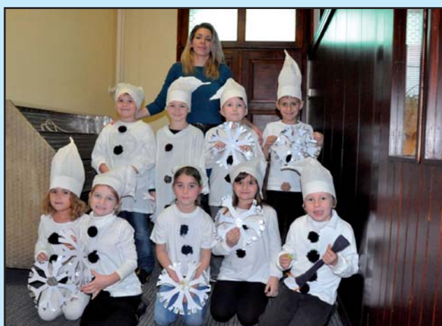
Vystoupení pro seniory - 1. třída