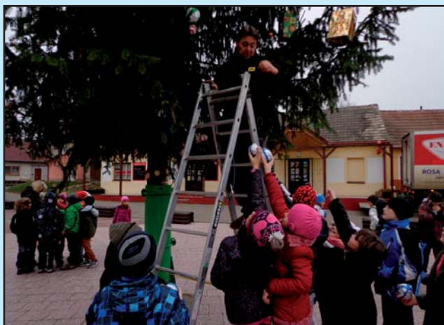
Zdobení vánočního stromu -2. třída