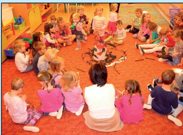
Mikuláš v MŠ