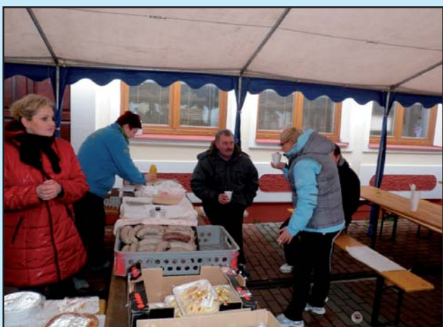
Tradiční Vánoční jarmark