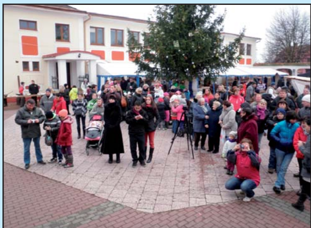
Tradiční Vánoční jarmark