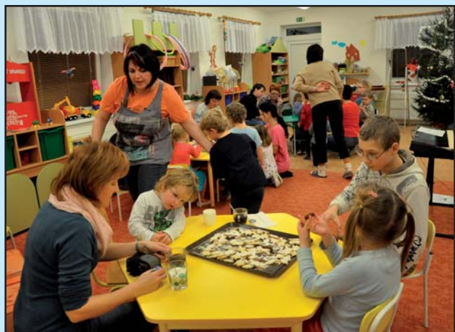
Vánoční těšení v MŠ