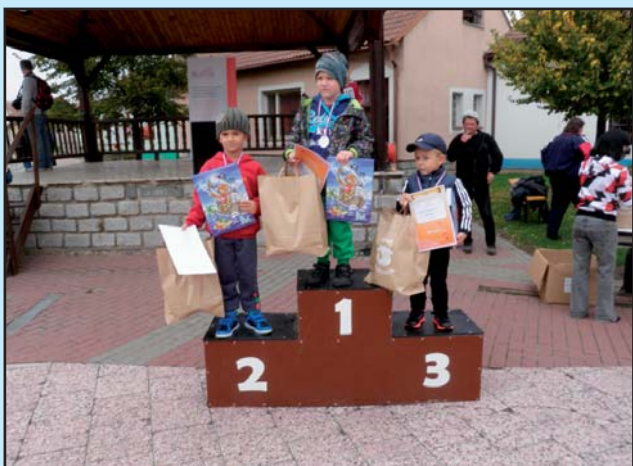
Vítězové Běhu Bořeticemi, ročník 2008-11