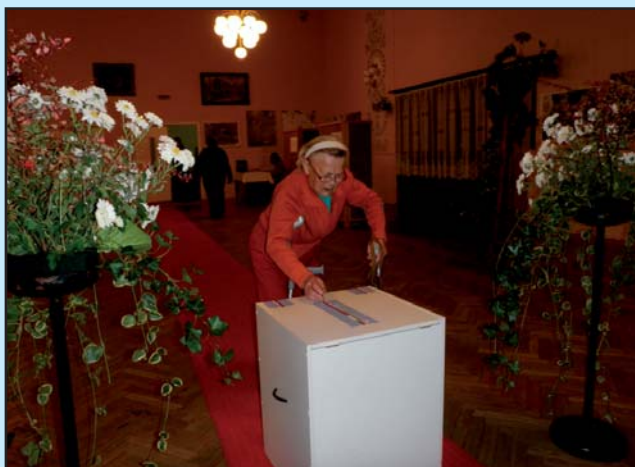
Volby do Parlamentu ČR 25. - 26. října