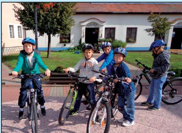
Dopravní výchova ve 4 třídě