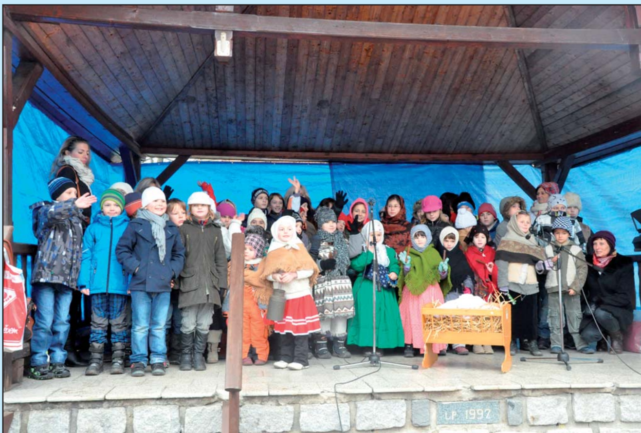
Jarmark- vystoupení ZŠ a MŠ