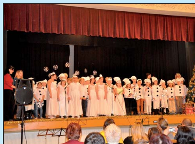
Vystoupení pro seniory - ZŠ