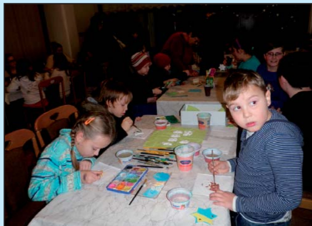
Tradiční Vánoční jarmark-dílnička