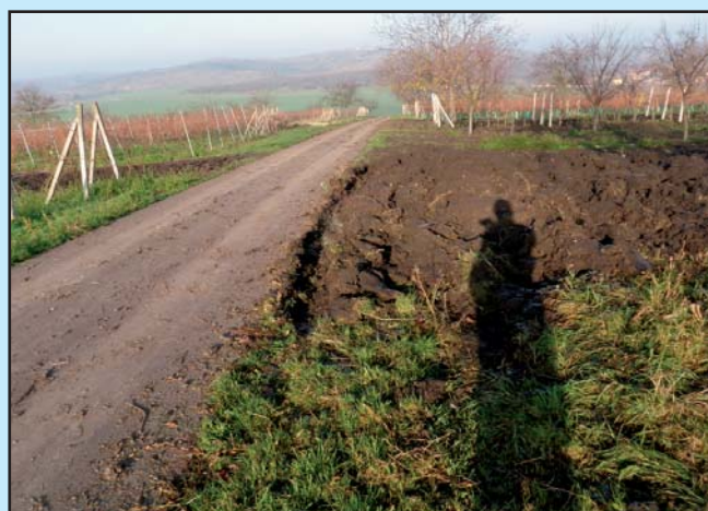
Znečišťování a ničení vozovky za kostelem