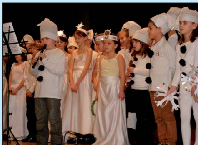
Vystoupení na setkání ze seniory