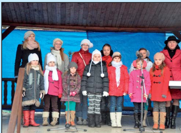
Tradiční Jarmark - vystoupení ZUŠ V.Pavlovice