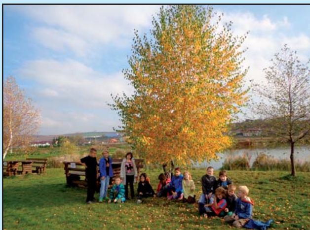
Přírodovědno- turistický kroužek - podzimní vycházka