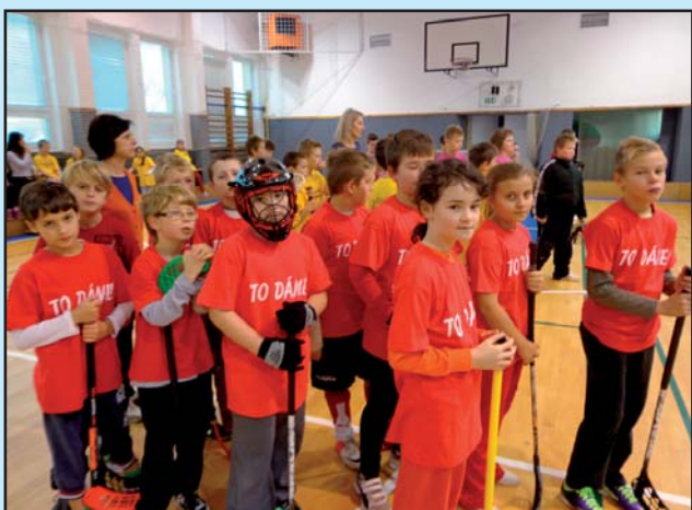
Turnaj ve florbale, Kobylí - 4.+5. třída