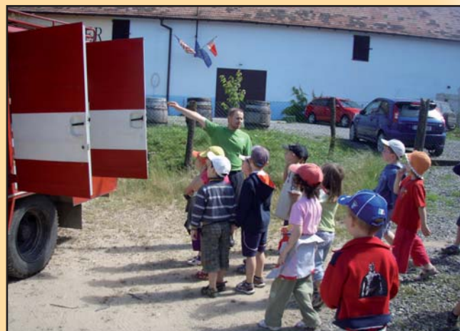
SDH předvádějí techniku