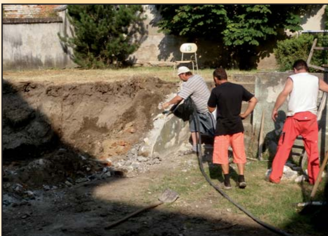
Úpravy školního dvora