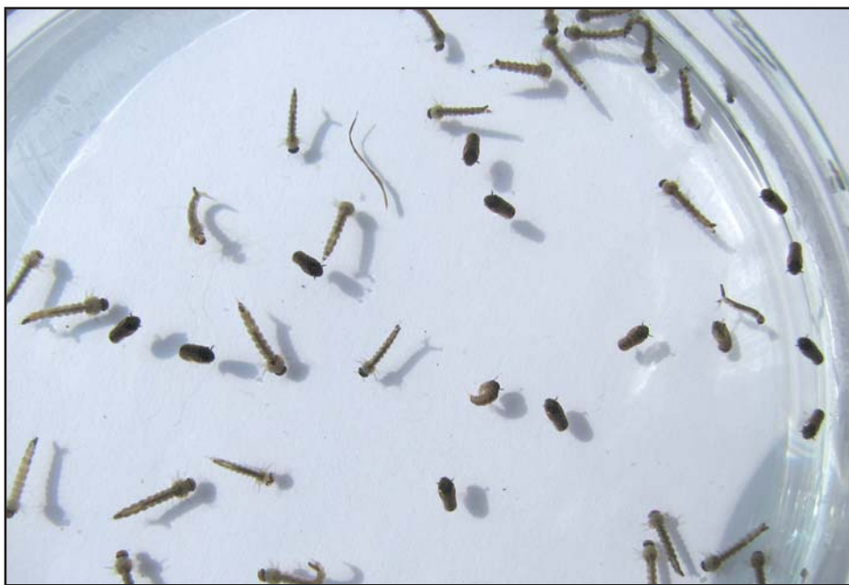
Larvy a kukly komárů. V tomto okamžiku je již na postřik pozdě

Aplikací larvicidních přípravků proto nevznikají v přírodě žádné škody. Fakt že po sobě nezanechávají ani rezidua, má ovšem i určité nevýhody – působí pouze na místě, kde byly aplikovány a po relativně krátkou dobu. Spolehlivě zabíjejí jen larvy, které jsou v okamžiku postřiku aktivní, na vajíčka ani kukly komárů nepůsobí. Vývoj larev je v letních měsících velmi rychlý a trvá často jen jediný týden, nebo jen o málo déle. To znamená, že postřik musí být proveden již velmi brzy po začátku povodní a vhodné období pro aplikaci trvá jen několik dnů. Protože je výskyt larev komárů v přírodě nenápadný a lidé obvykle řeší problémy které je zrovna tíží, na larvy komárů se obvykle zapomene. Až na sebe komáři upozorní samy v podobě štípanců od jejich samiček, je na postřiky proti larvám už dávno pozdě. Jsou zde však i další problémy. V době rozsáhlejších záplav je problémem i velká náročnost na provedení práce. K postřiku se většinou používají zádové postřikovače a terén se musí projít místo vedle