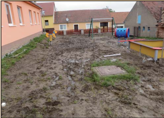
Stavba dětského hřiště