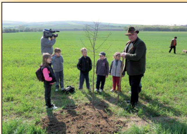
Sázení švestkové aleje ke Dni Země