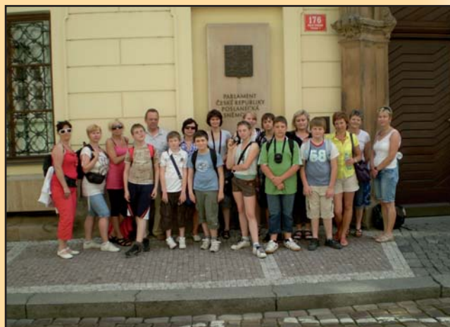
Pátáci v Praze