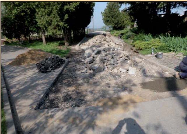
Oprava cesty kolem hřbitova