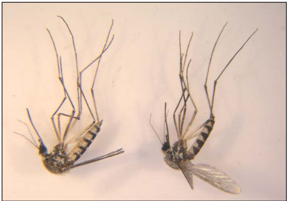
Naše hlavní kalamitní druhy komárů – Ae. vexans (vlevo) a Ae. sticticus (vpravo)

V některých státech (např. Německo) se situace řeší použitím speciální techniky (vrtulníky schopné aplikovat zmražené krupky a opatřené navigací), dokonalým zmapováním ohrožených oblastí, precizní organizací monitorování a rovněž vyřešeným způsobem financování, to je však u nás zatím hudba budoucnosti.