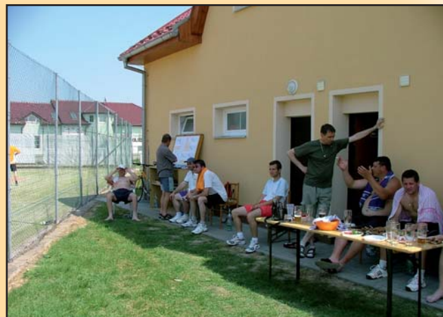
Tenisový turnaj o pohár starosty