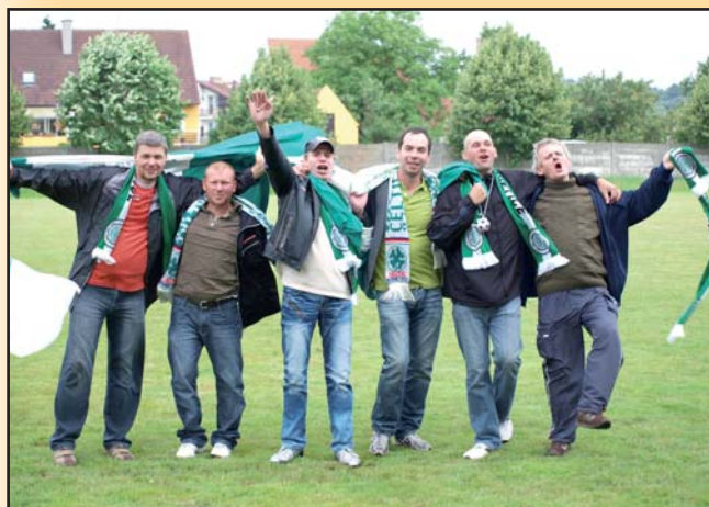
Fotbalisté postupují do krajského přeboru I. A třídy