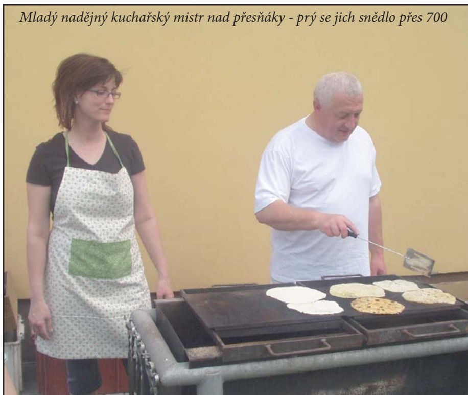
Mladý nadějný kuchařský mistr nad přesňáky - prý se jich snědlo přes 700

Počasí se vydařilo, přítomní diváci se dobře bavili při pečení a konzumaci přesňáků, kterých jsme napek-