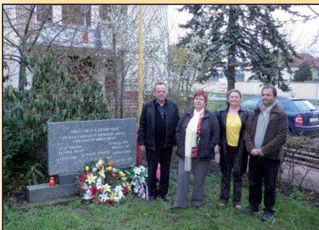
Položení věnce k pomníku obětem druhé sv. války