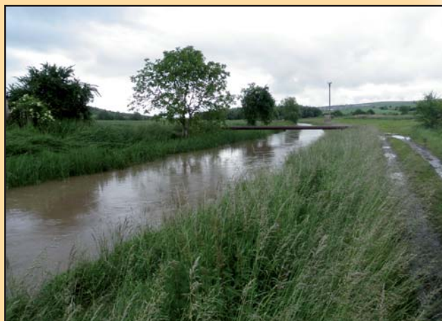
Záplavy hrozily i v Bořeticích