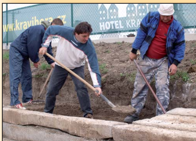
Fotbaloví funkcionáři pomáhají budovat tribunu