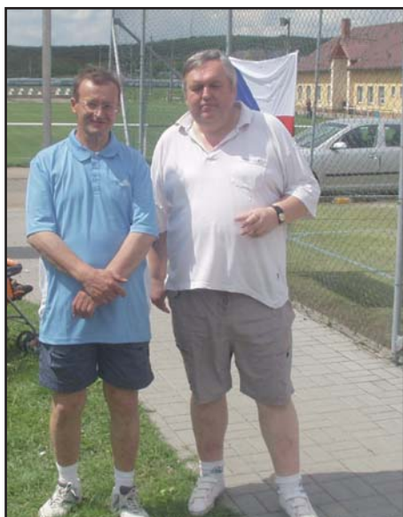
O přesňák místostarosty - ve čtyřhrách 4. místo - nadějná nejstarší dvojice - 109 let