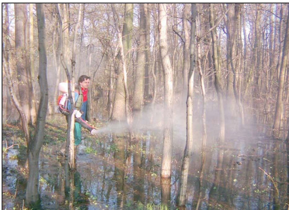
Postřik proti larvám komárů

V současné době se objevují v obchodech i volně prodejné prostorové insekticidy (označené obvykle