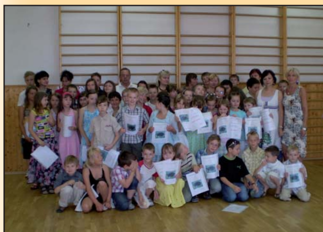
Konec školního roku