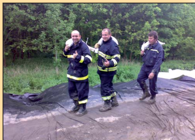
Stavění protipovodňové hráze