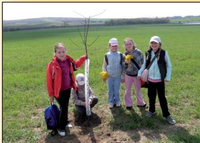
Sázení švestkové aleje ke Dni Země