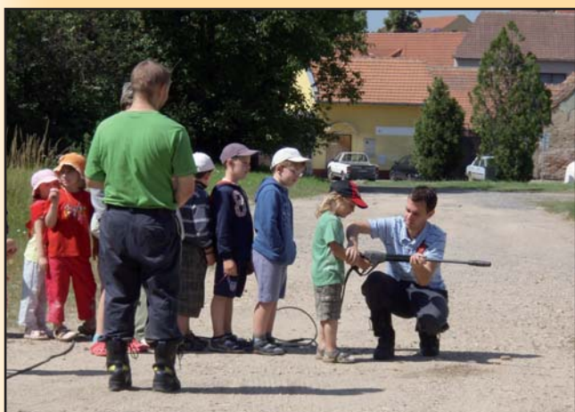
SDH předvádějí techniku