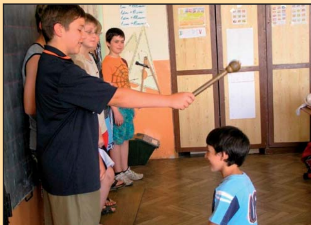
Předávání žezla páťákům