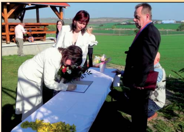
Zápis do matriky