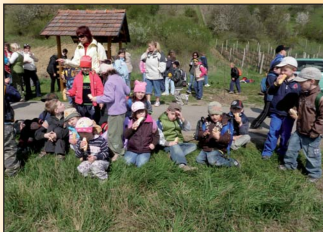
Sázení švestkové aleje ke Dni Země