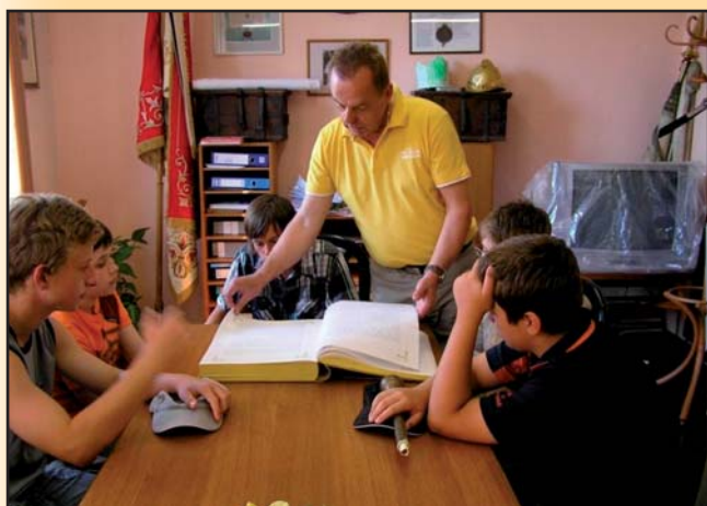
Pátáci u starosty