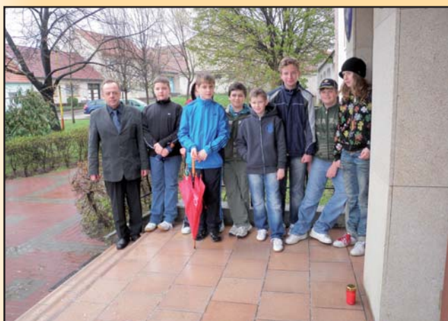
Uctění památky polského prezidenta