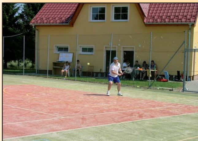
Tenisový turnaj o pohár starosty