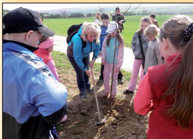
Sázení švestkové aleje ke Dni Země