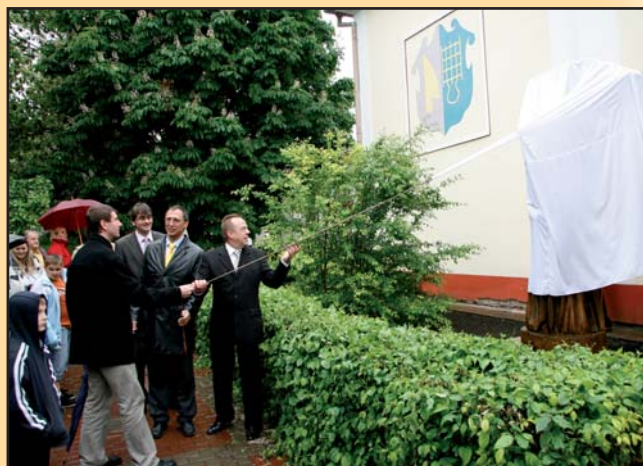
Odhalení sochy zakladatele Bořetic